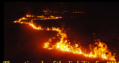
The rationale of the liability for אש

כי תצא אש ומצאה קוצים ונאכל גדיש או הקמה או השדה שלם ישלם המבעיר את הבערה